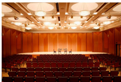
写真提供 サントリーホールブルーローズ (小ホール)